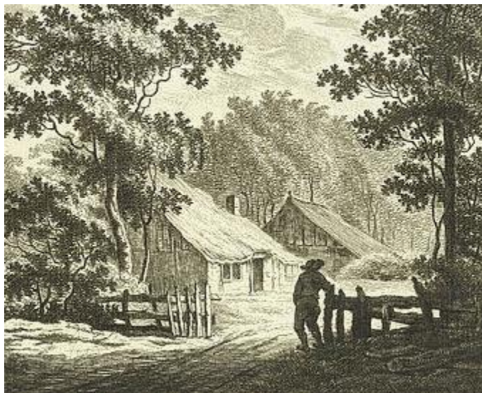
Ivan Cankar: HLAPEC JERNEJ